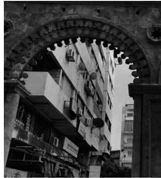
Moderne und Tradition in Latakia.

Ein anderes Beispiel ist der Amnesty International Bericht vom 7.2.2017 über die Justizvollzugsanstalt Sednaya (ca 30