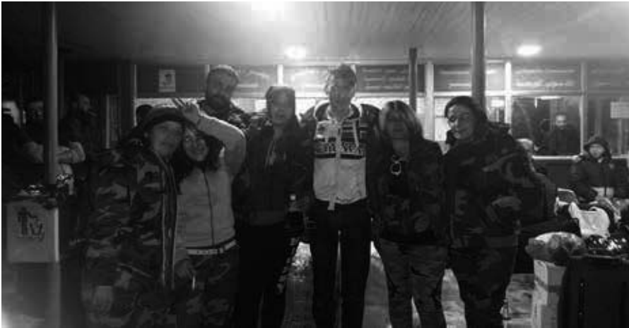
Begegnung mit syrischen Soldatinnen auf dem Busbahnhof von Tartus.

die, die auf diese Weise abgeworben werden. So sehen meine Freunde das und ich auch. Zumindest so lange sie nicht zurückkommen.