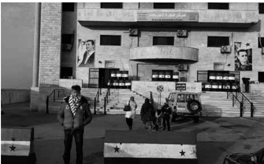
Grenzübertritt vom Libanon nach Syrien in Al Areeda (23.12.2016).

Aber diese Sorgen waren in der Empfangshalle in Beirut sofort verflogen. Dort standen die beiden Männer, die mich ab-