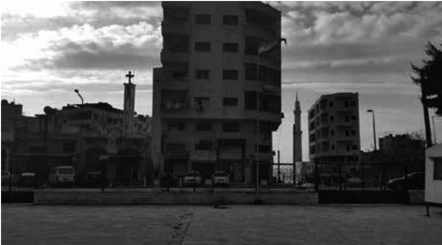
Realität in Syrien: Links ein Kirchturm, rechts ein Minarett, in der Mitte die syrische Flagge.

holen und nach Latakia bringen sollten. Mein Erkennungszeichen war meine grüne Jacke. Sie kamen sofort auf mich zu und umarmten mich, sie waren so herzlich, dass meine Angst von da an Vergangenheit war und ich mich wie zu Hause gefühlt habe.