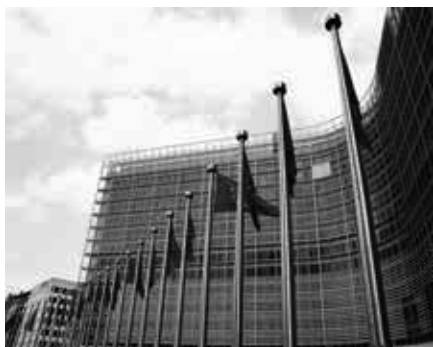
Das 1963 bis 1967 erbaute Berlaymont-Gebäude in Brüssel ist der Sitz der Europäischen Kommission

Für deutsche Leser sind Diesens Hinweise zur Position Europas besonders relevant und interessant. Die EU sei eine „bürokratische und regulatorische Supermacht“, die Zugang zu ihrem enormen Markt nur unter Akzeptanz diskriminierender Bedingungen erlaubt und sich so ein Netz