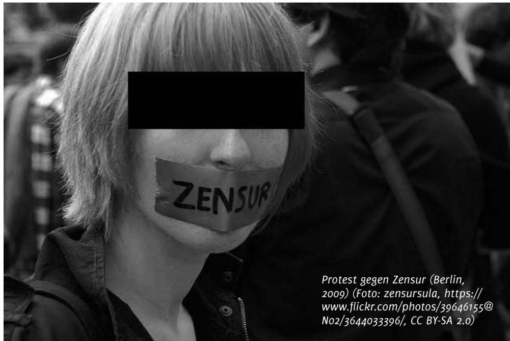
Protest gegen Zensur (Berlin, 2009)