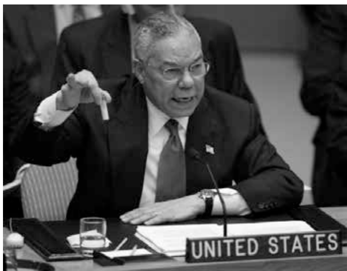
Der US-amerikanische Außenminister Colin Powell mit einem kleinen durchsichtigen Röhrchen in der Hand als „Beweis“ von Massenvernichtungswaffen in Irak - was Colin Powell aber verschwiegen hat: Schon im ersten Irakkrieg 1991 haben die USA und ihre Alliierten zum ersten Mal Massenvernichtungswaffen in Form von vielen Tonnen Bomben und Granaten aus abgereichertem Uran eingesetzt.

Eine Erklärung für das Schweigen der Leitmedien über den Einsatz von Uranwaffen und dessen Folgen sei, meint Claus Biegert, dass mächtige Institutionen gar kein Interesse an einer Diskussion des Themas haben, denn das internationale Recht sieht vor: Für die Beseitigung von Kriegsmaterial, vergifteten Böden und Wasser sind die Verursacher verantwortlich. Für zivile Opfer müssten sie sich vor dem Internationalen Gerichtshof verantworten. Eine Ächtung der Uranwaffen schmälere nicht nur die Gewinne der Waffen- und Transportindustrie, sondern sie werfe auch Fragen der Entschädigung auf, die nicht vorgesehen waren [2].