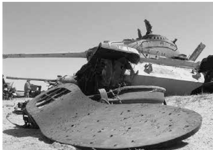
„Highway of death“, Irak 2003

rer Brennstäbe aus Uran 235 für die Atomindustrie. Es enthält aber noch etwa 60 Prozent der Radioaktivität des ursprünglichen Uranerzes aufgrund seines hohen Gehaltes an Uran 238, einem langsam zerfallenden Alpha-Strahler mit einer Halbwertszeit von 4,5 Milliarden Jahren [2].