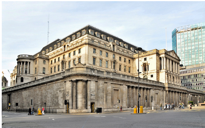
Bank of England: Rückte 2014 mit der Wahrheit heraus, nachdem die BBC den Beweis von Professor Werner dokumentiert hat

Dieses Geld wird auch Giralgeld oder Fiatgeld (engl. fiat money) genannt. Letzteres abgeleitet vom lateinischen Bibelzitat aus der