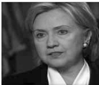
Außenministerin Hillary Clinton bei den CBS Nachrichten am 6. Oktober 2009: „Wir haben Al-Qaida erschaffen“

Nordamerika, als Nation, ist abhängig von Krieg und ist es seit Jahrzehnten. Im Jahr 2014, wurden