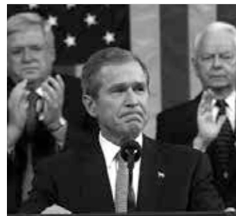
Bush erklärt den „Krieg gegen den Terror“ am 20. September 2001

In neokonservativen Kreisen wurde geglaubt, dass der einzige