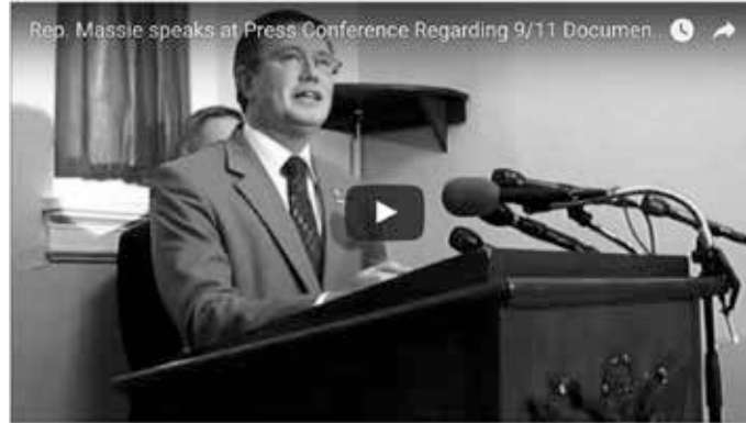
Rep. Thomas Massie was one of the first to read the redacted 28 pages from the 9/11 commission report: "It challenges you to re-think everything. I think the whole country needs to go through that", he said at a press conference on Jul 11, 2014