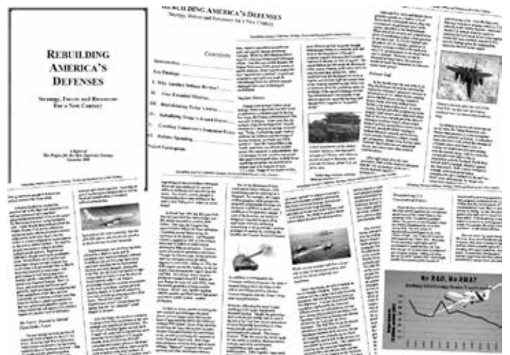
Ein Meilenstein um den aktuellen Zustand der Welt zu verstehen ist der Bericht „Rebuilding America's Defenses“ - „... dieser Prozess der Umwandlung ist wahrscheinlich ein sehr langer Prozess, wenn ein katastrophales und beeinflussendes Ereignis – wie ein neues Pearl Harbor fehlt...“, veröffentlicht im September 2000 vom „Projekt for a New American Century.“

Aber die Saudis waren hierin nicht allein. Ein 61 Seiten langer Bericht